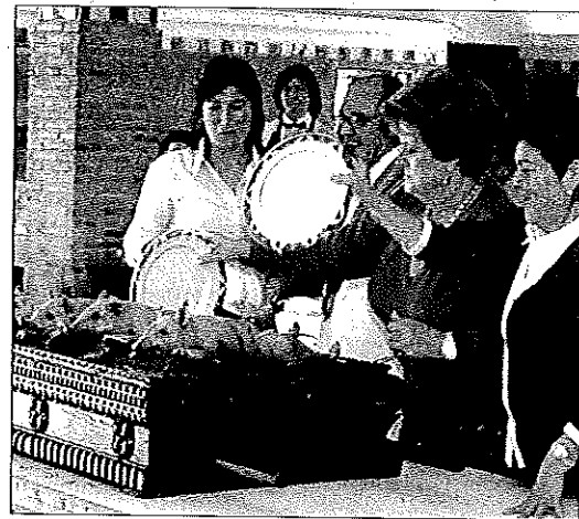
El troceado del cochinitillo con platos se hace delante de los comensales

Será sin duda una buena oportunidad de degustar hoy la gastronomía que reinará en el futuro de la mano de los alumnos y profesores de la escuela granadina.