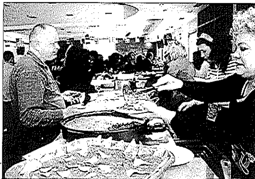
El encuentro reunió a 600 vecinos de todas las nacionalidades.

Organizadas por el Ayuntamiento finense, en colaboración con el área de servicios sociales de la diputación provincial, y coordinadas desde el servicio de información al inmigrante del consistorio, estas jornadas se enmarcan dentro de la semana de la interculturalidad, cuyas actividades se dirigen también a trabajar con los alumnos de los centros docentes de la localidad a favor de propiciar una mejor convivencia y la asunción de la diferencia cultural como un elemento positivo que propicia riqueza a toda sociedad. Juan Goytisolo comenzó narrando la profunda impresión que le produjo su viaje a Almería. En palabras del autor, ese primer contacto supuso.