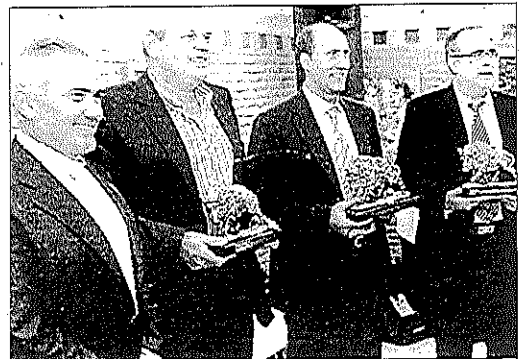
Algunos de los galardonados con el 'Jabalí de Plata'.